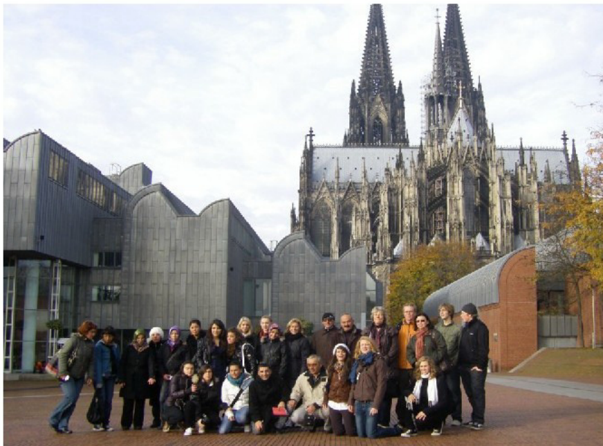
In der Domstadt Köln

"Schnell, schnell, schnell" – das hatte bald jeder gelernt, und das damit verbundene Tempo wurde auch gleich als typisch deutsche Eigenschaft interpretiert. Dabei waren es die Gäste, die darauf bestanden hatten, in drei Tagen Köln, den Landschaftspark und Berlin zu besichtigen, darüber hinaus im Duisburger Rathaus empfangen zu werden und auch noch deutschen Unterricht zu besuchen. Schließlich ist man ja nicht so oft in Deutschland. Vermutlich hatten sie damit gerechnet, dass wir angesichts der Wunschliste abwinken würden. Duisburg? – natürlich! Köln? – na klar! Berlin? – vielleicht! Aber wir wollten uns der Herausforderung stellen und keine Wünsche offen lassen. So wurde die unglaubliche Geschwindigkeit der bestimmende Parameter dieser "Mobility".