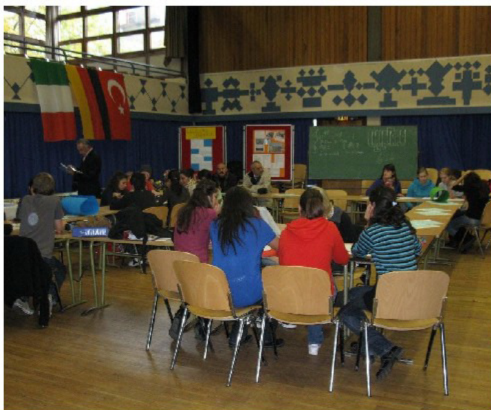
Projektarbeit in der LfG-Aula