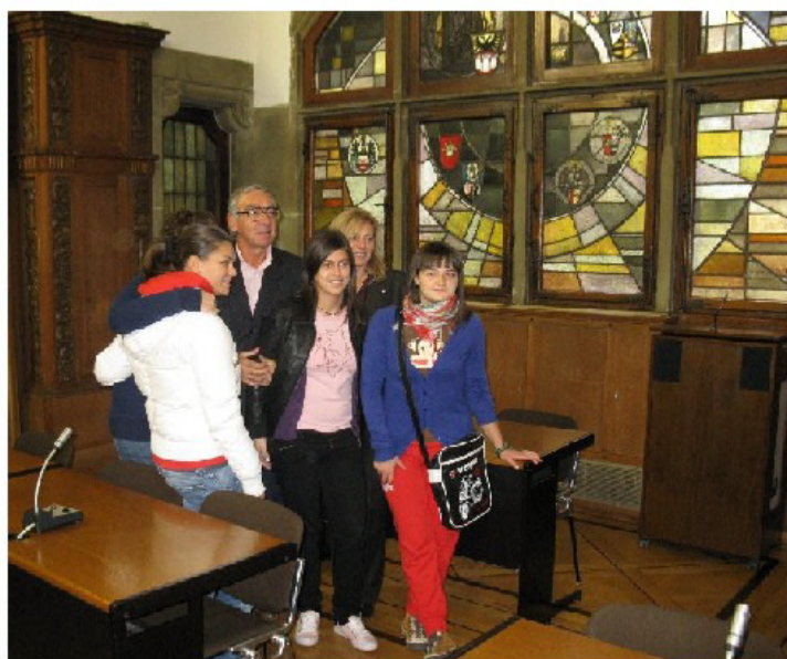
Im Sitzungssaal des Duisburger Rathauses

Gespannt warteten wir auf erste Reaktionen der Gäste nach dem Besuch. Und überrascht waren wir darüber, welch positives Gesamtbild sich ergeben hatte.